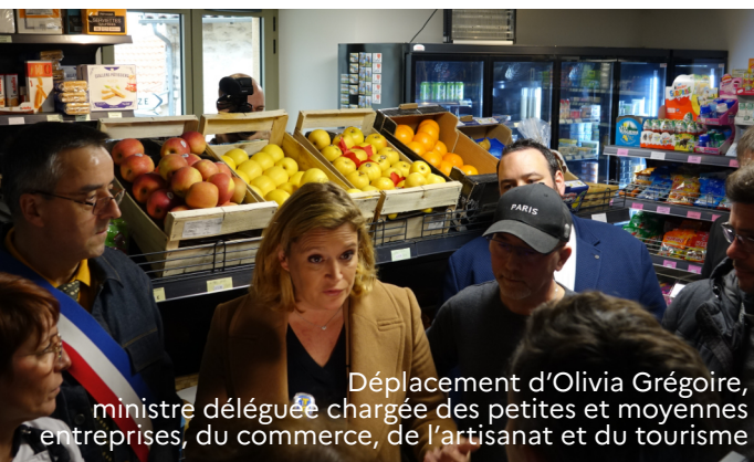
Déplacement d'Olivia Grégoire, ministre déléguée chargée des petites et moyennes entreprises, du commerce, de l'artisanat et du tourisme

Le soutien apporté dans le cadre du dispositif vise les dépenses d'investissement dans des projets d'installation de commerce dont le modèle économique est jugé viable. Toutefois, compte tenu des spécificités intrinsèques aux zones rurales et plus particulièrement la faible densité démographique de la zone de chalandise, ces projets ne pourraient émerger sans une contribution publique.